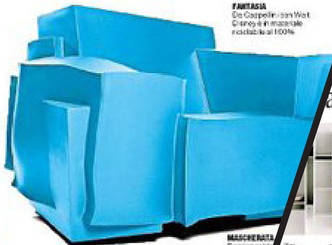
FANTASIA Da Cappellini con Walt Disney è in materiale riciclabile al 100%