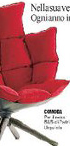
COMEDA Per il tavolo Raffaelli Poltrona Upright

Nella sua versione ecologica e riciclata piace a stilisti e designer che la utilizzano in modo inaspettato. Ogni anno in Italia se ne recuperano 710mila tonnellate: "Una mentalità nuova, che le dà un valore diverso"