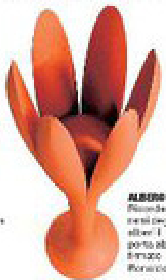
ALBERO Riscende i nervi degli allergici. È però abbi- tando Rovato