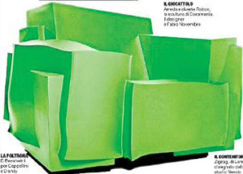
LA POLTRONA D. Pavesenti D. Pavesenti per Cappellini e Disney