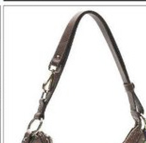
Per questo il riciclaggio interiore.