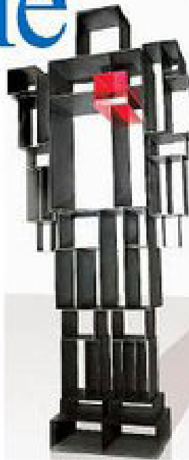
IL CROCIATOLO Arredo e diverte. Roboto, la scultura di Corramano, il designer è Fabio Novembre